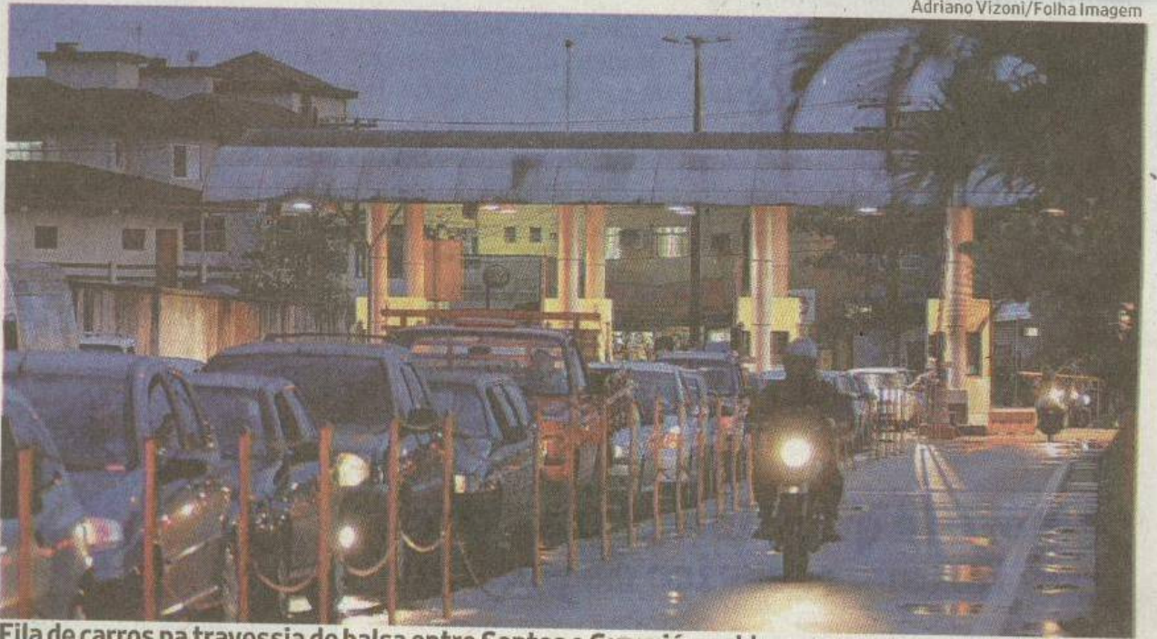
Fila de carros na travessia de balsa entre Santos e Guarujá; problemas começaram em julho